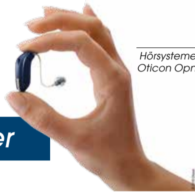
Hörsysteme Oticon Opn

Menschen mit intaktem Gehör finden sich bei einer Familienfeier zurecht, weil sie sich in der gesamten 360°-Umgebung orientieren. Sie sind in der Lage, einzelne Klänge und Stimmen zu erkennen und sich auf das zu konzentrieren, was sie hören wollen. Sie können jederzeit die Aufmerksamkeit spontan auf einen anderen Gesprächspartner oder ein anderes Hör-Ereignis richten.