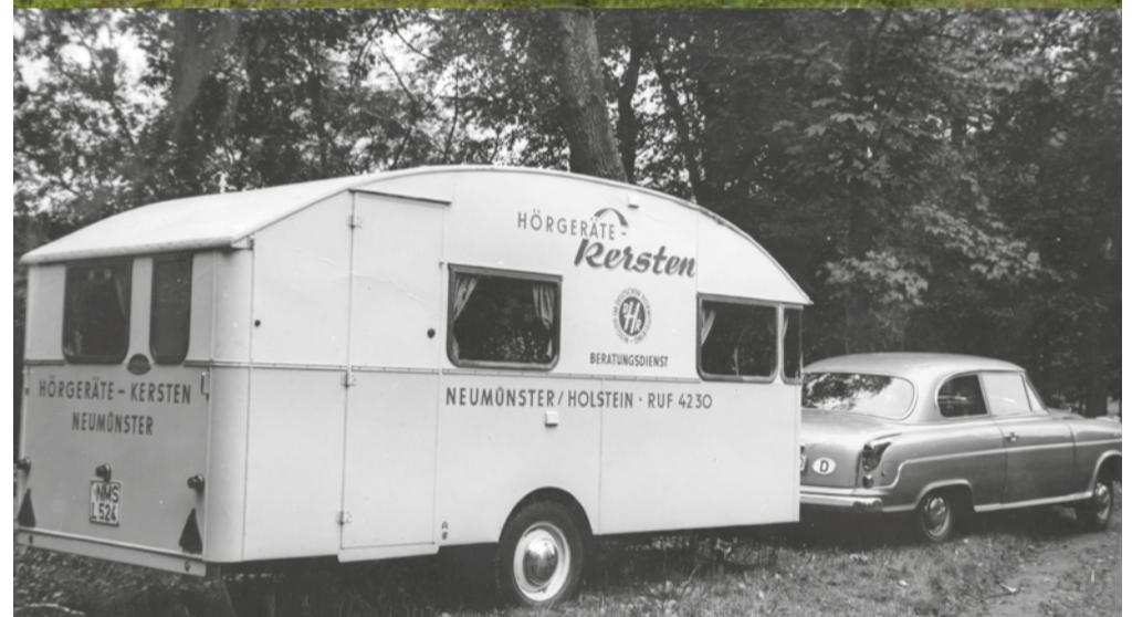
Das Hörmobil früher - Bereits 1958 wurde das erste mobile Hörsystem-Fachinstitut eingerichtet, um auf Marktplätzen in den Städten Hörtests, Beratungen und Anproben anzubieten.