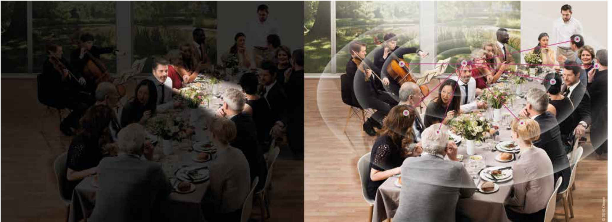
Oticon Opn arbeitet mit einem neuen Konzept, bei dem alle Gesprächspartner der Runde übertragen werden.

Neue Hörgeräte-Technologie bietet erstmals eine Lösung für das Problem Nr. 1: