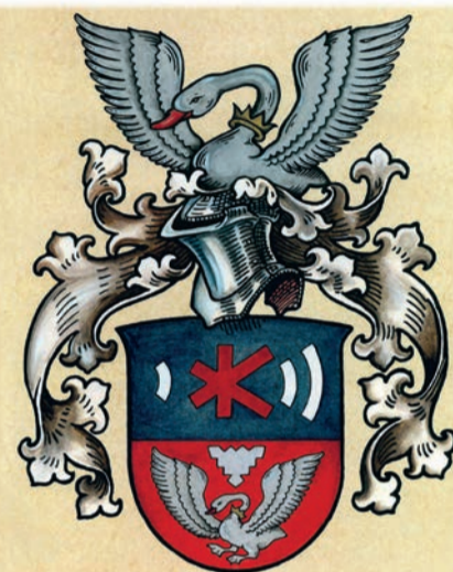
Wappen der Familie Kersten

Das Wappen der Familie Kersten: Der Schwan, welcher stellvertretend für die Stadt Neumünster steht, fällt als Erstes ins Auge; ein Hörsymbol und die klassischen Merkmale an Verzierungen runden das bereits seit 1950 bestehende Familienwappen ab.