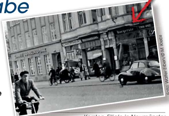
Kersten-Filiale in Neumünster in den 1950er-/60er-Jahren