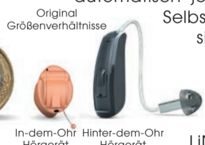
Original Größenverhältnisse In-dem-Ohr Hörgerät Hinter-dem-Ohr Hörgerät

konzentrieren, was wichtig ist, ohne dabei den Kontakt zur Umgebung zu verlieren. Man kann Gesprächen mühelos folgen oder seine Aufmerksamkeit ganz selbstverständlich einer anderen Sache zuwenden. ReSound LINX 3D passt sich automatisch jeder Hörumgebung an. Selbst in schwierigen Hörsituationen ist der Klang angenehm und reichhaltig.“