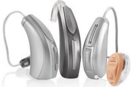
NOW IQ Hörgeräte von NuEar

Die NOW IQ Hörgeräte von der Marke NuEar ermöglichen Ihnen ein einzigartiges Hörerlebnis. Laute Töne werden weniger verstärkt, während leise Töne dagegen sensibel aufgenommen und intensiviert werden. Dadurch klingen Gespräche klarer und Hintergrundgeräusche werden als weniger störend wahrgenommen.